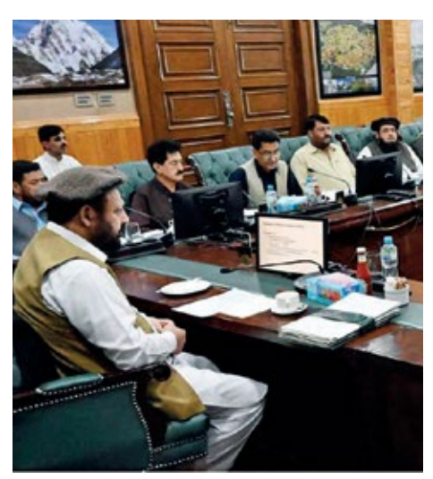
اقدامات کے ذریعے معاشی اور ساجی افق کووسیع کرناہے۔

وزیراعلی حاجی گلبرخان کی زیرصدارت گلگت بلتستان کا بینه کے 12 ویں اجلاس میں گلگت بلتستان و بمن امپاورمنٹ پالیسی اسٹر یخی اور ایکشن پلان 2024–2029 کی منظوری دی گئی کینیڈا کی مالی اعانت سے چلنے والے BEST4WEER پروجیکٹ کے تحت اعانت سے چلنے والے AKRSP خواتین کو مجموعی طور پر بااختیار بنانا اور صنفی مساوات کو نقینی بنانا ہے۔ اور ساتھ ہی آئییں مساوی رسائی ، ضرورت پر بینی پر وگرامز ، شعبہ جاتی اصلاحات اور مختلف ادارہ جاتی ، قانون سازی ، مالی اور انظامی